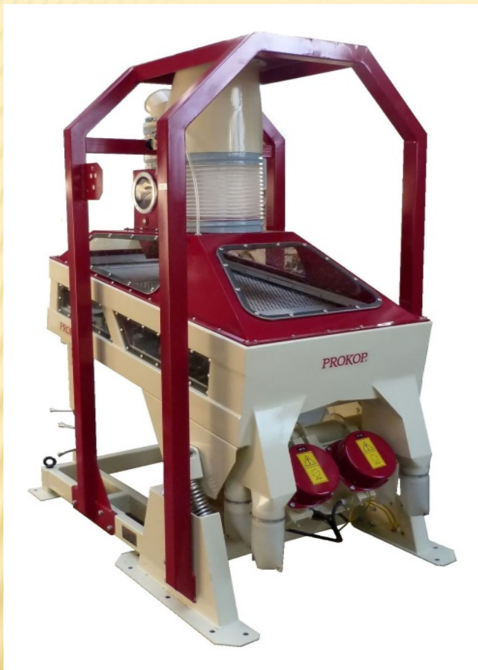
Odkaménkovač PVS 2-7